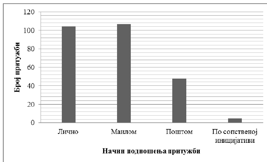
Графикон 1. Начин подношења притужби Заштитнику грађана